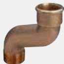
S-lok - za izenačitev razdalje pri priključni plošči vodnega števca (zamik pri 1=70 mm, pri 1¼=80 mm) - rdeča ali silicijeva litina - R-navoj, Rp-navoj Model 3004